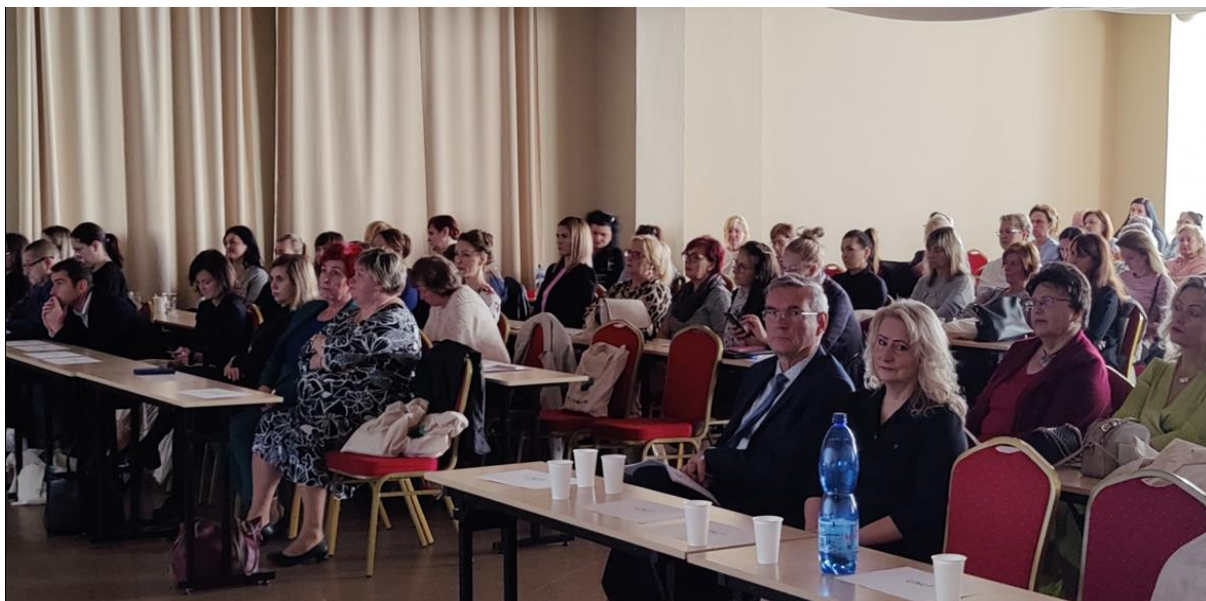
Foto 4: Prezentovanie prednášky Význam klasifikačných systémov v ošetrovatelstve pre vzdelávanie a prax